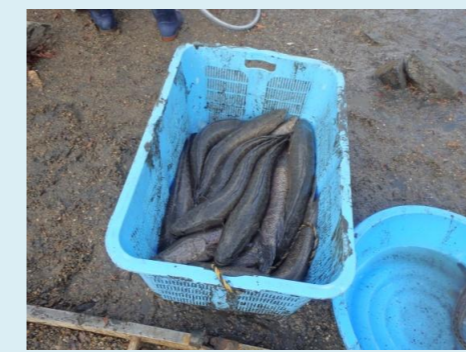
捕獲されたライギョ(外来種)