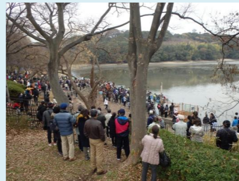
朝早くからたくさん見学の方が来られました

【協力団体】(順不同、敬称略) テレビ東京・十和養魚場・NPO birth・枚方高校生物飼育部・山田池土地改良区・枚方いきもの調査会