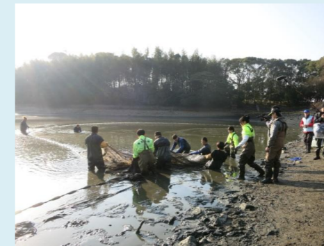
仕掛けた地引網を引きます