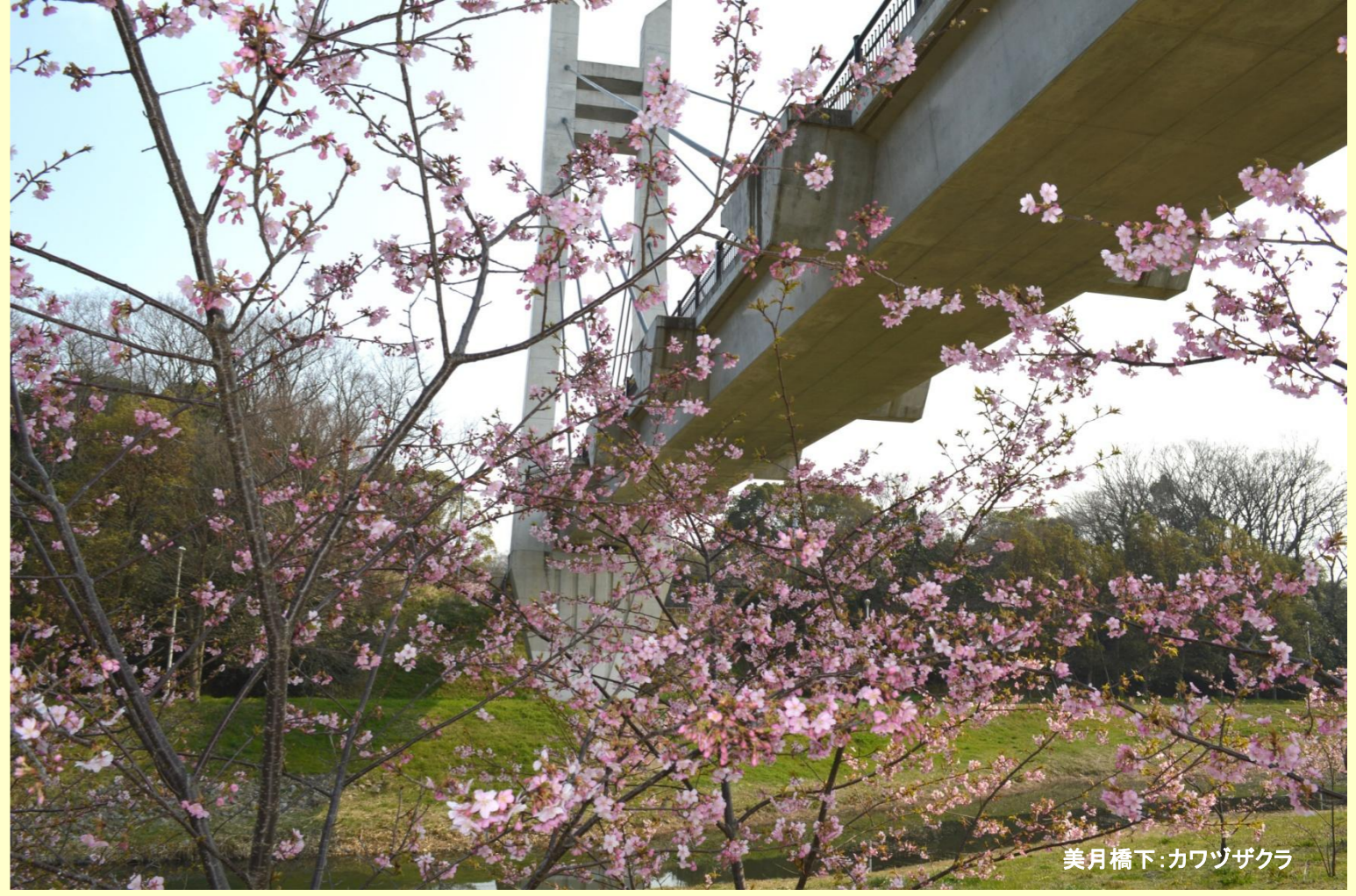
美月橋下:カワヅザクラ