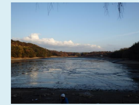
水が無くなった山田池