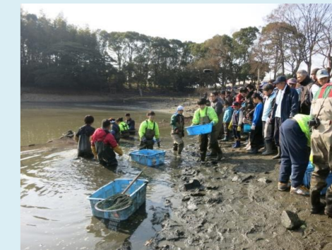
捕獲した生きものの仕分け