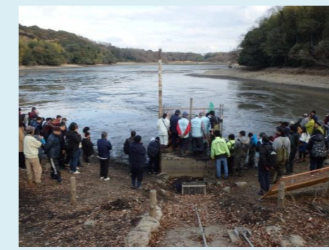
一番下の泥樋を開けて最後の水を抜きます