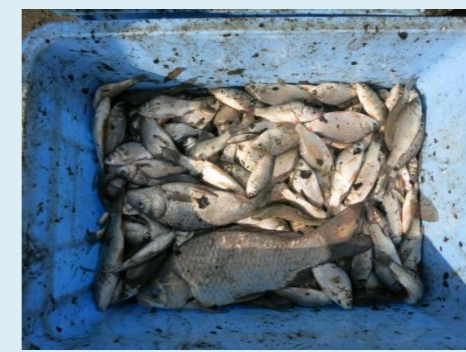
捕獲された在来魚