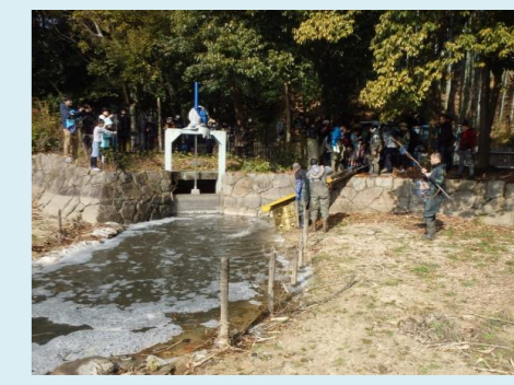
捕獲した在来魚は小さい池に放流