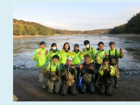
皆さまお疲れ様でした!