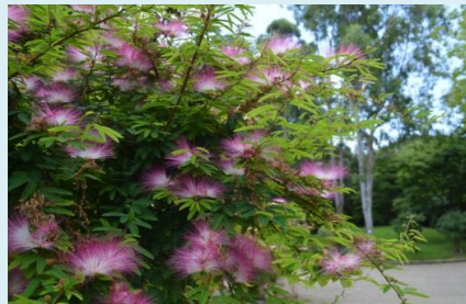
トキワネム：事務所前花壇 花期：7月～10月