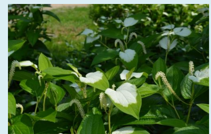
ハンゲショウ：実りの里、水生花園 花期：6月下旬～7月初旬