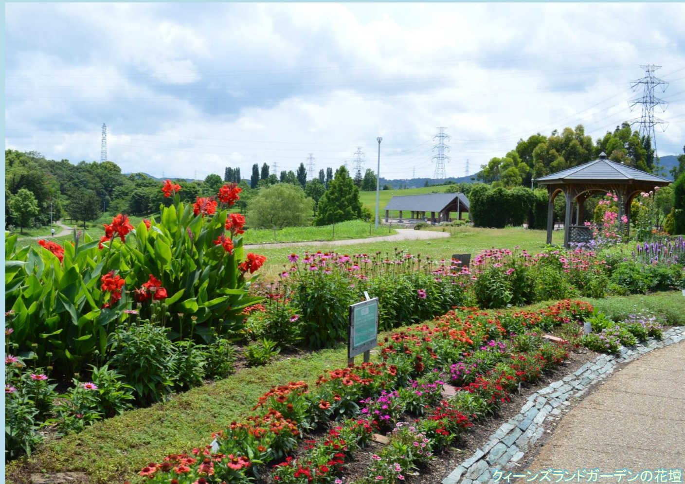
クィーンズランドガーデンの花壇