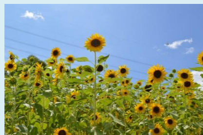
ヒマワリ：ラベンダー花壇 花期：8月下旬