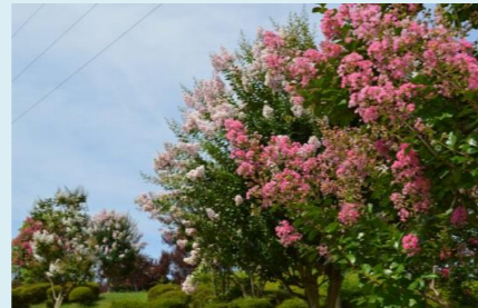
サルスベリ：花木園 花期：8月中旬～下旬