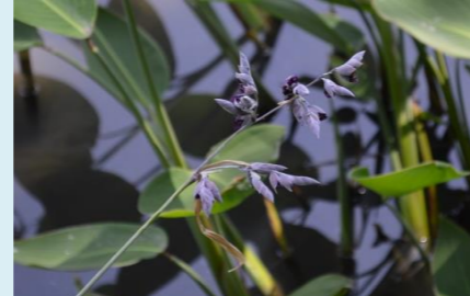
ウォーターカンナ：水生花園 花期：6月下旬～7月