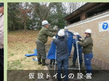
仮設トイレの設置