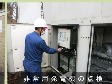
非常用発電機の点検