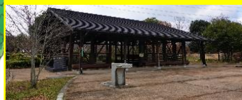
⑤第2駐車場前掲示板