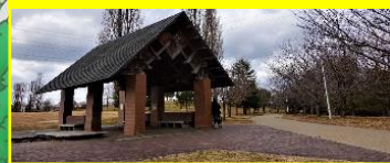
③テラス広場休憩所