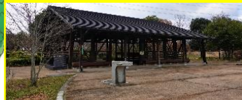
⑤第2駐車場前掲示板