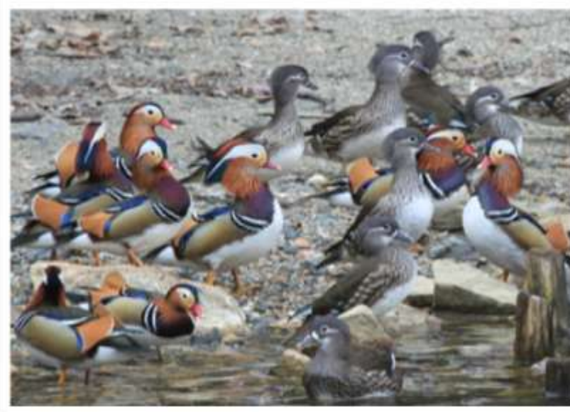
オシドリ 冬鳥 45cm 色のきれいなのが♂、地味なのが♀ 多い時は200羽ほどもやってくる

秋から冬にかけて、北の国から渡り鳥が日本に渡ってきて、春には北に帰ります。この季節は山田池公園でも多くの方が撮影や観察に訪れます。山田池公園で冬のあいだに見られるおもな渡り鳥を紹介します。