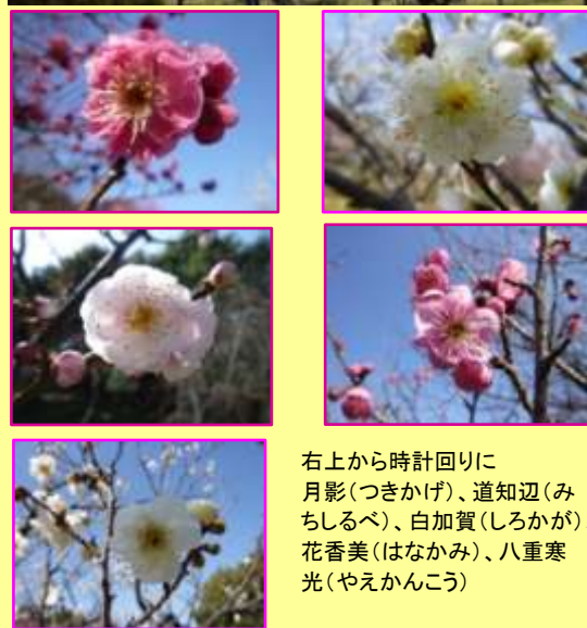
右上から時計回りに 月影(つきかげ)、道知辺(みちしるべ)、白加賀(しろかが)、 花香美(はななみ)、八重寒光(やえかんこう)