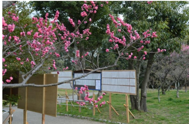
早春の俳句は梅林に掲示します