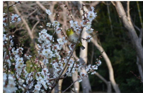
梅の見ごろにはメジロが集まってきます

山田池公園の中ほどにある花木園梅林では、毎年1月の中頃から3月のお彼岸の頃まで、約300本の梅が次々と開花します。早咲きの八重寒紅に始まり、2月末から3月の初めにかけて最も多く見ごろを迎えます。お彼岸の頃に遅咲きの琳子梅が見ごろを迎え、梅の季節は終わります。