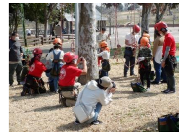
さあ、登ってみましょう