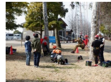
登り方の説明を聞きます