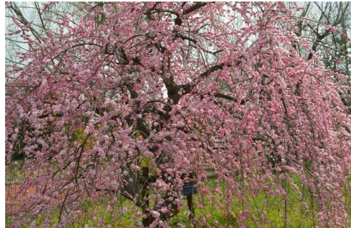
パークセンター裏、満開のシダレウメ

梅の花は花木園の他に、南地区の実りの里や池せせらぎ沿いでも見られます。中でもパークセンター裏、池せせらぎ沿いのシダレウメは、見ごろになると写真を撮りにたくさんの人が訪れる人気スポットです。