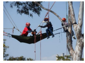
無事に登れました！

集合時間：① 10:00 ② 11:00 ③ 13:00 定員：各5名（小学生対象） 参加費：おひとり 500円 服装：汚れてもいい服 持ち物：軍手、バンダナ ※雨天中止 ※参加には事前申し込みが必要です。 申込開始は園内掲示板または公園ホームページでお知らせします。