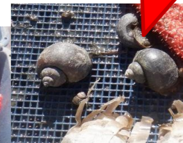
スクミリンゴガイの成貝。寄生虫がいる場合があります。