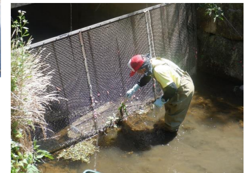
卵は水中では孵化できないため、ヘラでそぎ取り、水の中に落とします。