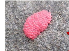
スクミリンゴガイの卵塊。卵には毒があります。

1981年、食用として台湾から導入されましたが、その後放棄され野生化しました。寿命は2～3年で、産卵期の4月～10月の間に20～30回産卵します。生息地は水田や水路などです。