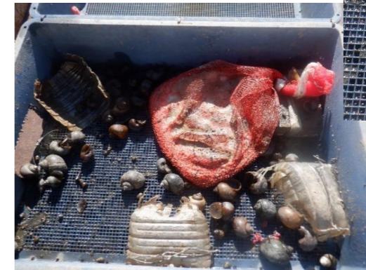
捕獲器の中には、エサとして米ぬかをいれてあります。1回の捕獲で約200匹の成貝が捕獲できます。