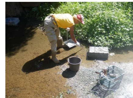
成貝はハサミで探って、回収し処分します。