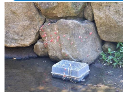
岩についた卵塊と捕獲器