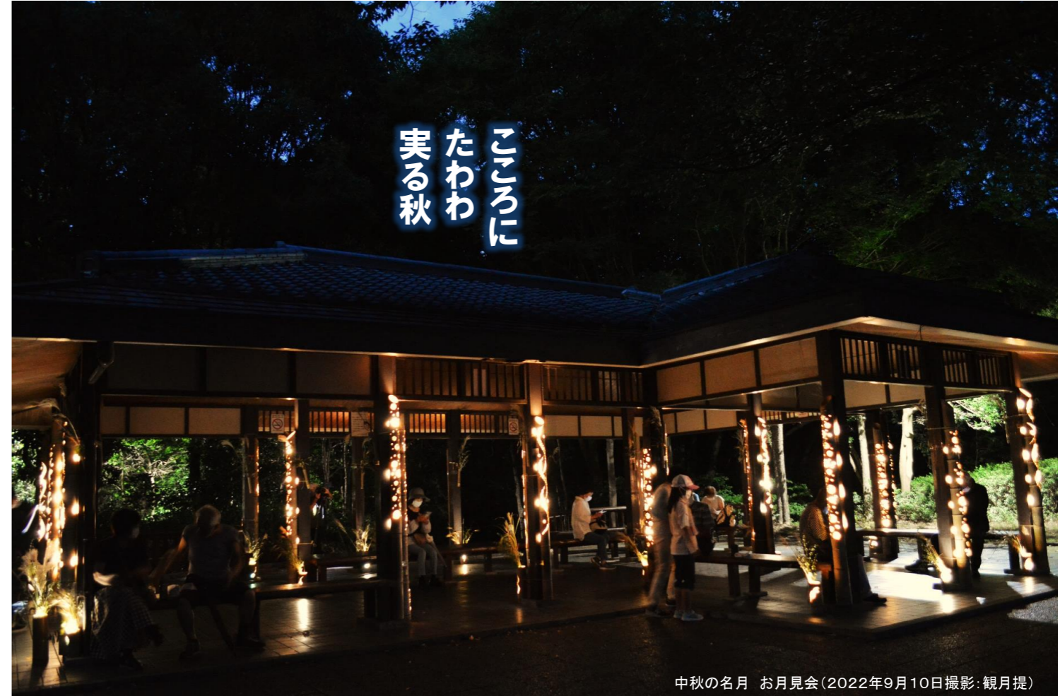
中秋の名月 お月見会(2022年9月10日撮影:観月提)